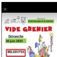
© N'œuf de cœur et Code Bar

Sur inscription au 06 41 05 95 83 jusqu'au 15 juin.