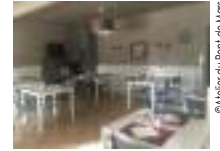
© Atelier du Pont de Mars