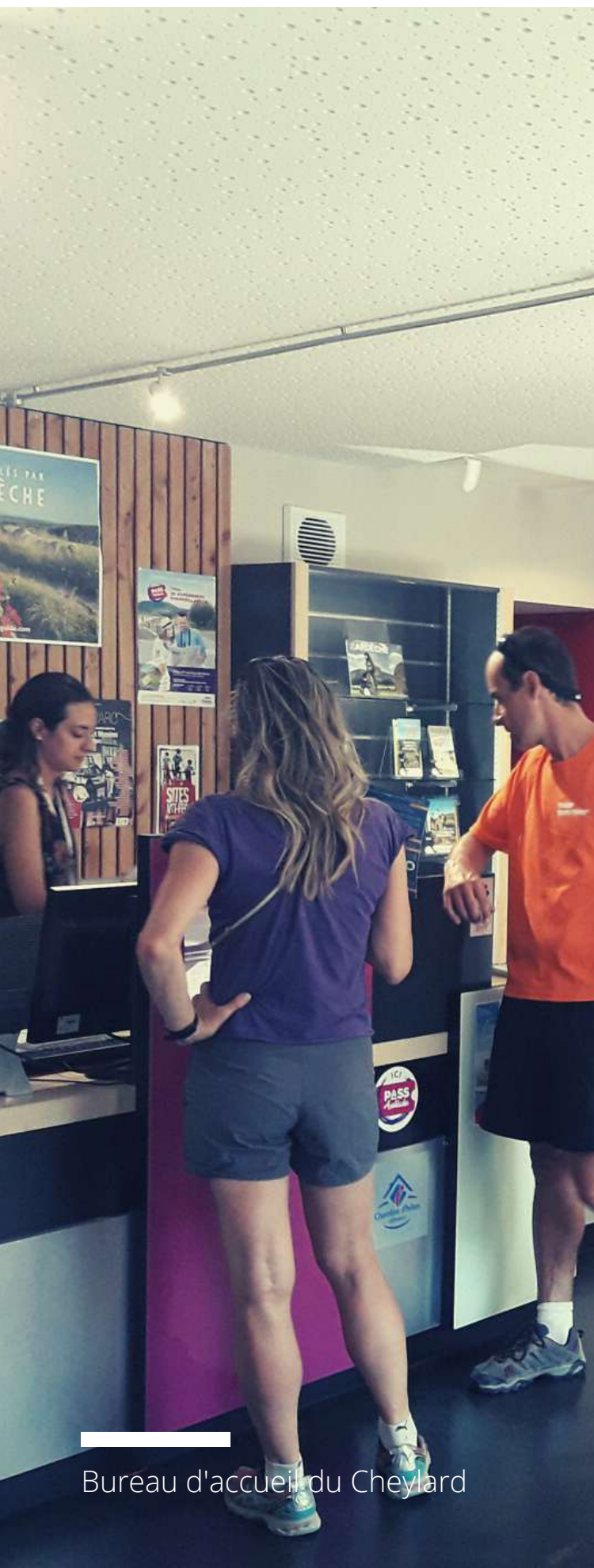
Bureau d'accueil du Cheylard